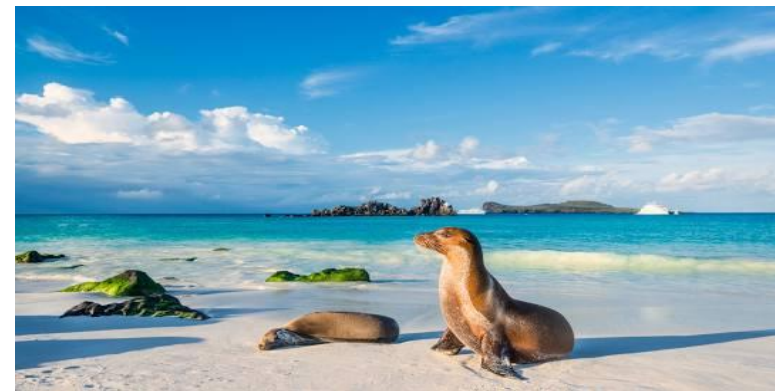
Галапагосские острова – архипелаг вулканического происхождения в Тихом океане