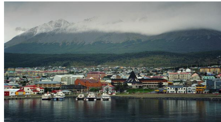
Самый южный город в мире — Ушуйя.