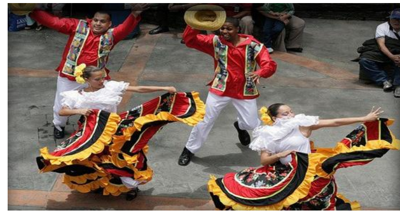
Традиционному танцу Венесуэлы – хоропо – более 300 лет