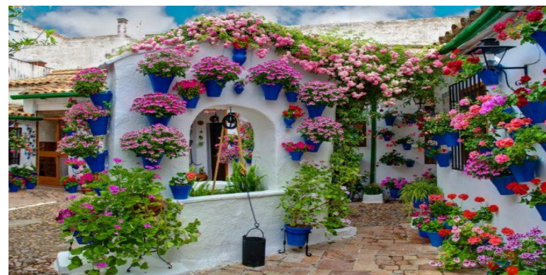
Фестиваль патио Кордовы