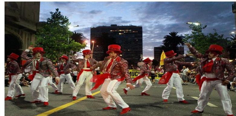
Самый длительный карнавал в мире — уругвайский