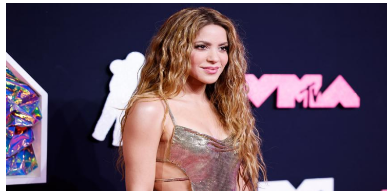
Современная поп-музыка Колумбии. Певица Шакира