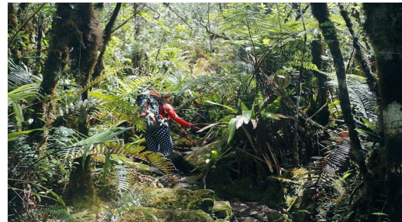
Треть Венесуэлы занимают саваны Лос Льянос