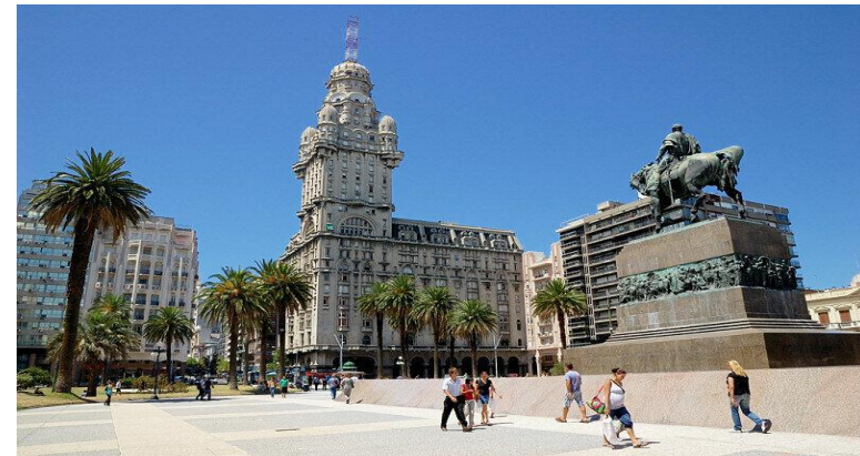
Уругвай самая маленькая страна Латинской Америки