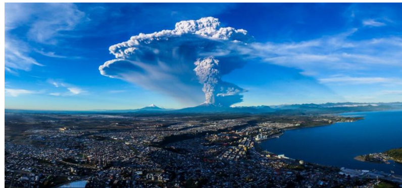
В Чили насчитывается около 90 действующих вулканов