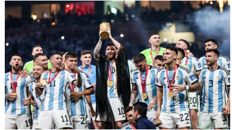
Сборная Аргентины по футболу стала чемпионом мира в 2022 г.