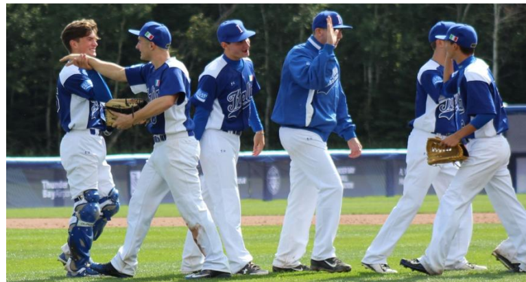
Самым популярным видом спорта является бейсбол