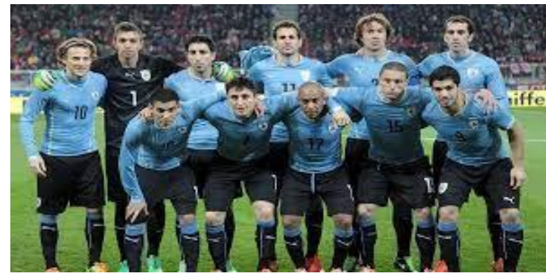
Футбол - религия Уругвая. Сборная по футболу несколько раз становилась чемпионами мира.