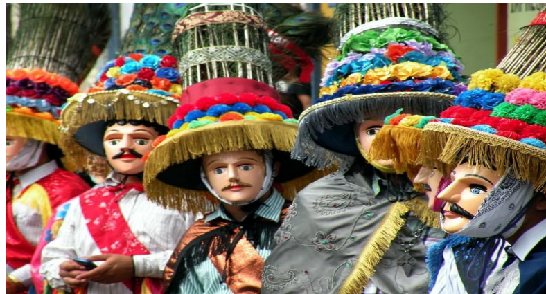
Раз в год все населенные пункты Никарагуа отмечают «фиеста патрональ» (день своего ангела-хранителя)