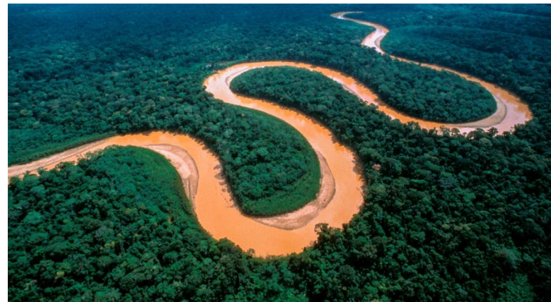
Река Амазонка - самая длинная река в мире