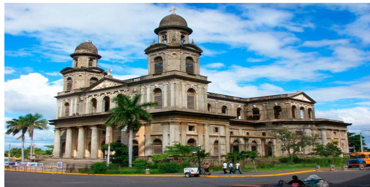
Манагуа стала столицей только в 1858 году