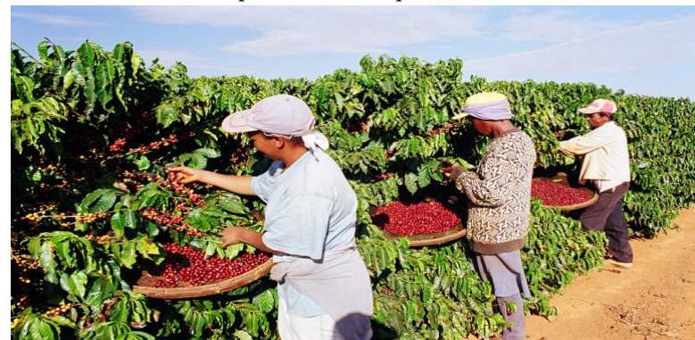
Крупнейший производитель кофе в мире