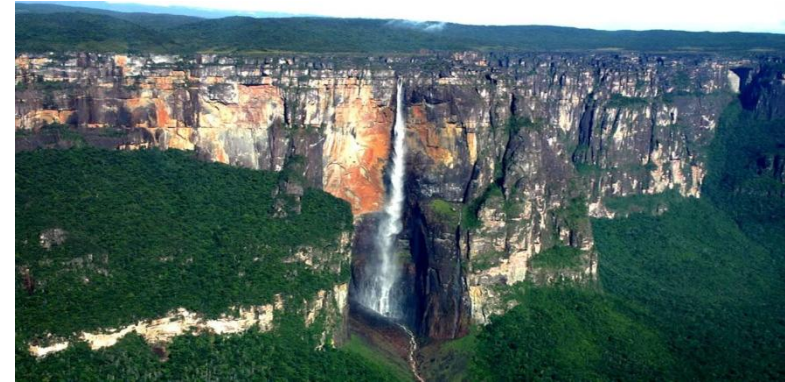
Самый высокий в мире водопад Анхель