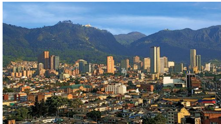
Столица Богота является самым опасным городом Колумбии